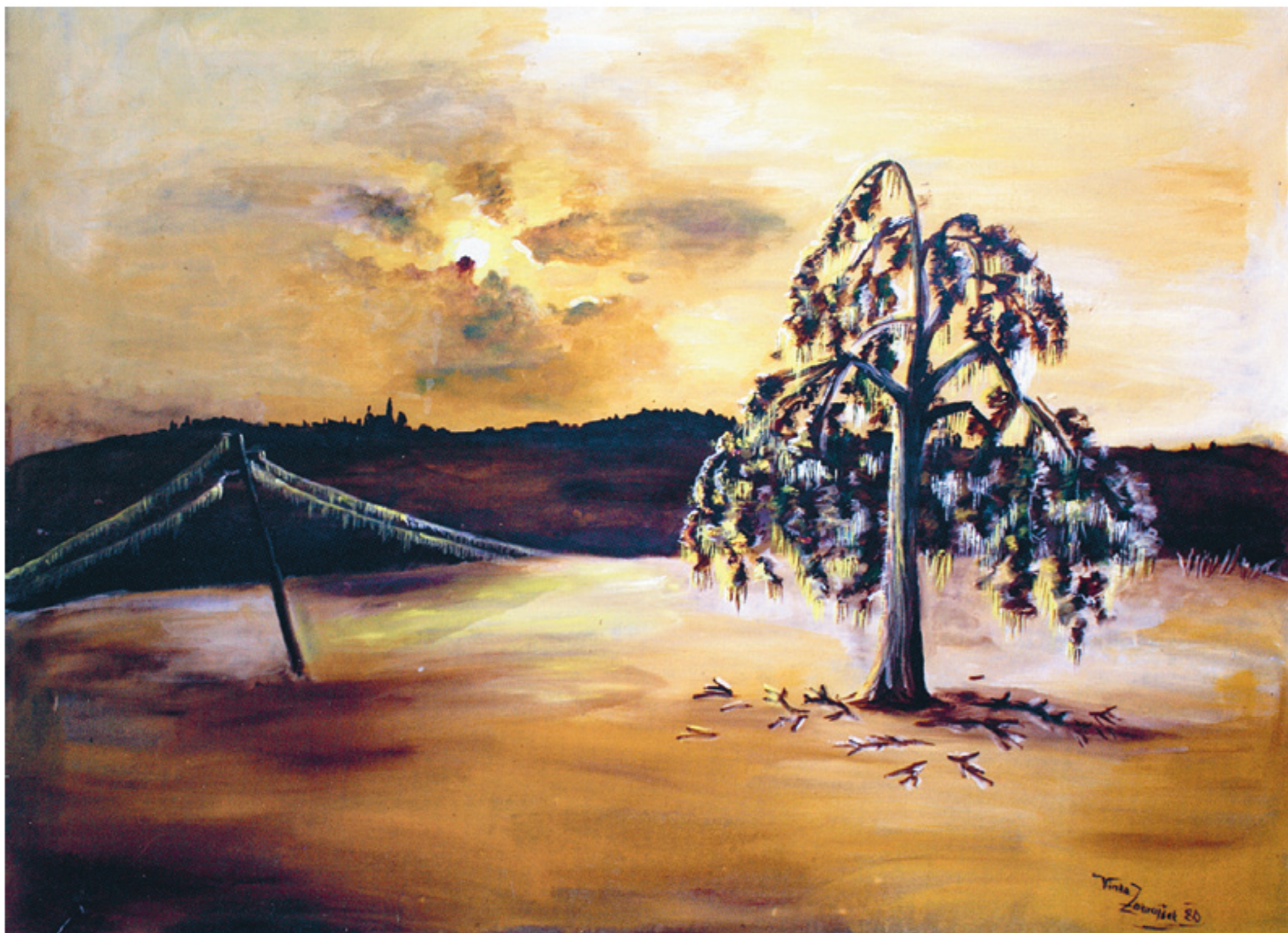
Vinka Zakrajšek: Žled v Brkinih , olje na platnu, 1980